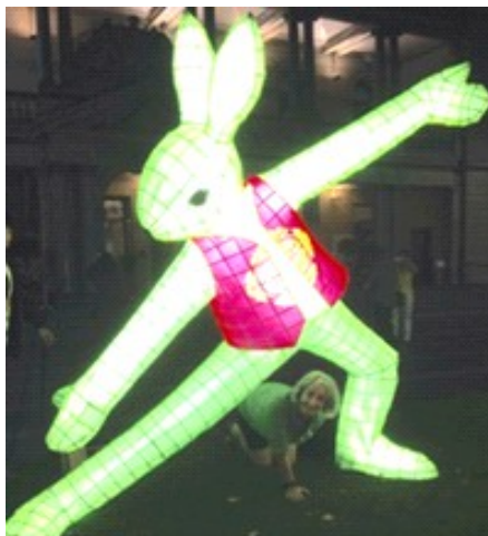
Tai chi kuniklo