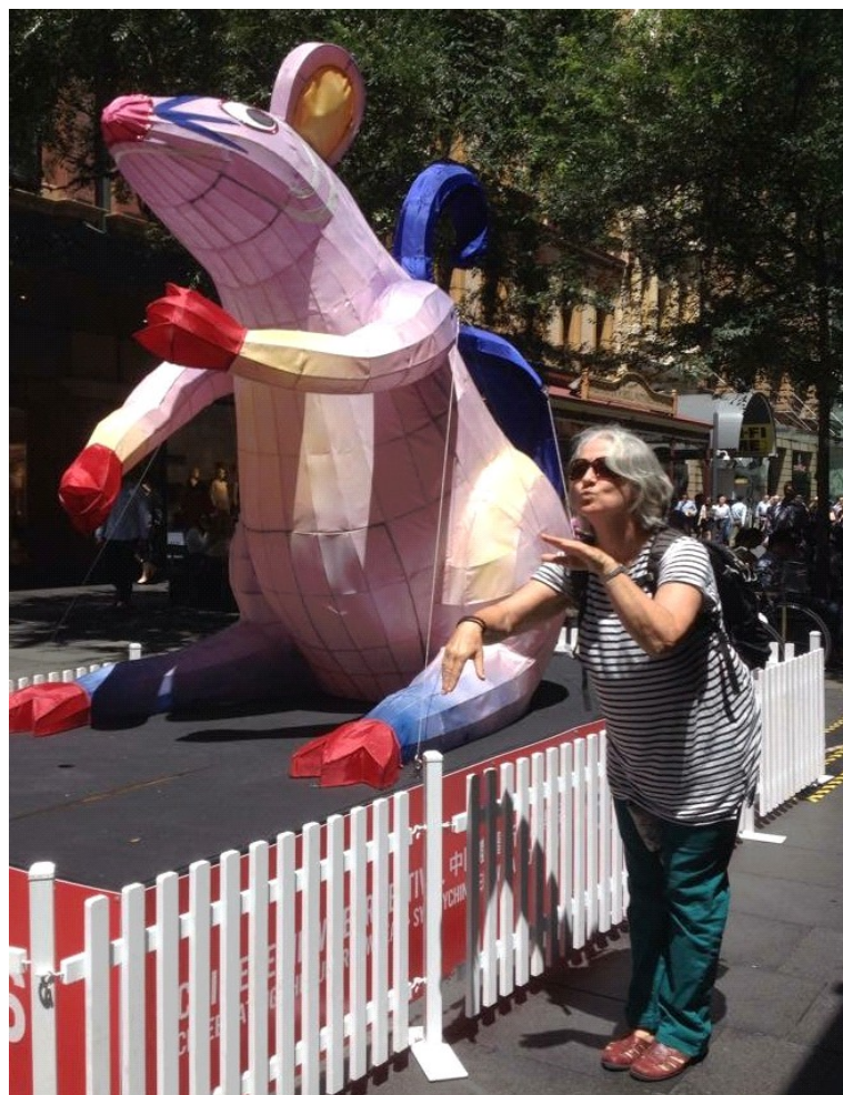
Kaj mian -la rato