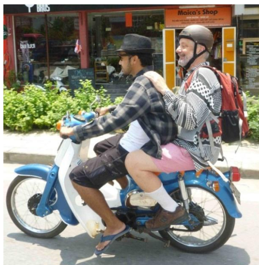
kuraĝa baldaŭa prezidanto de AEA sur motorbiciklo.