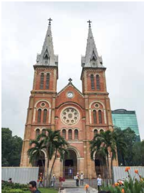
Katedralo Notre Dame en la urbcentro de Ho Chi Minh – proksimume 7% de la loĝantaro estas romkatolika

Do, kion fari en Ho Chi Minh? Laŭ mi, la urbo ankoraŭ ne estas tute preta por internacia turismo. Certe estas multaj hoteloj kaj