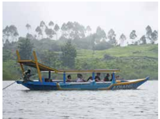
Esperantistoj en motorboato kiu rapide veturas en la lago.