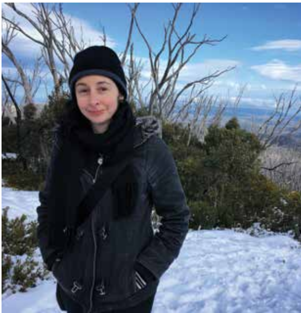
Mi ĉe la pinto de la monto