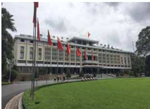
Eksta palaco de la eksa Prezidanto de Suda Vjetnamio ĝis 1975 kiam alvenis nord-vjetnama armeo