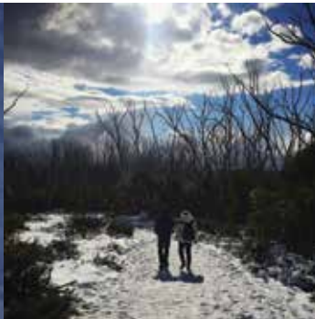
Tristan apogas Heather dum la glita promeno