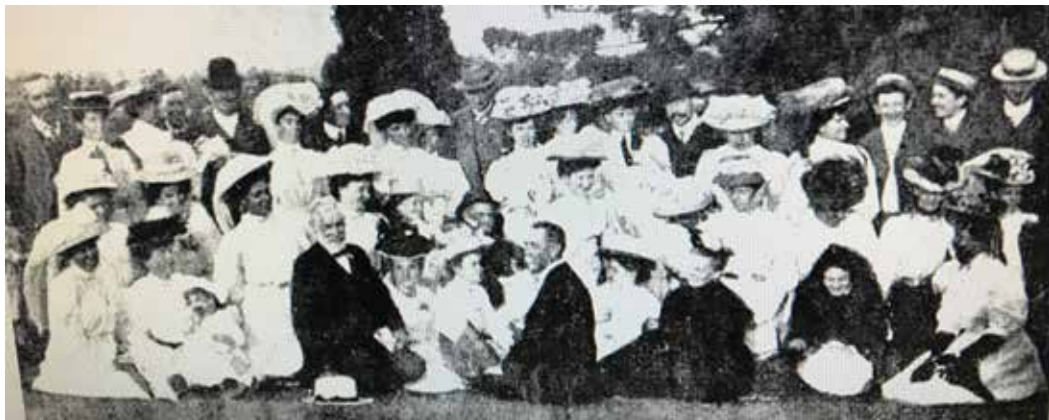
Melburnaj Esperantistoj piknikas. 'Leader' Melburno, 7 marto 1908.

El la fruaj Esperanto-asocioj tra Aŭstralio, la Melburna Klubo restis la plej granda. Ĝi supervivis du apartiĝojn: la Komerca Esperanto-Asocio kaj la Ido-Grupo. Antaŭ la unua mondmilito la klubo posedis Esperanto-Halon en Elizabeth-strato kiun ĝi luis al aliaj grupoj.