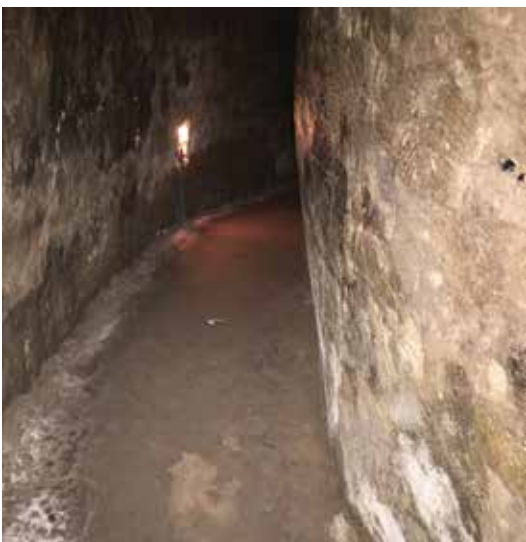
En ĉi tiuj mallarĝaj subteraj tuneloj kaŝis vjetnamaj soldatoj dum la milito