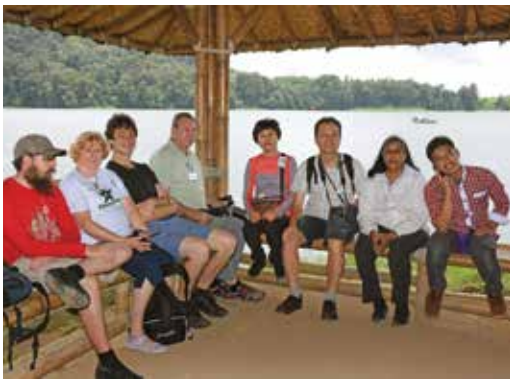
En publika kabaneto ĉe Situ Patengan. Ni sidis en la plej granda kabaneto kiu havas benkon ĉe la flanko de la konstruaĵo. Eble 60 homoj povas sidi tie.