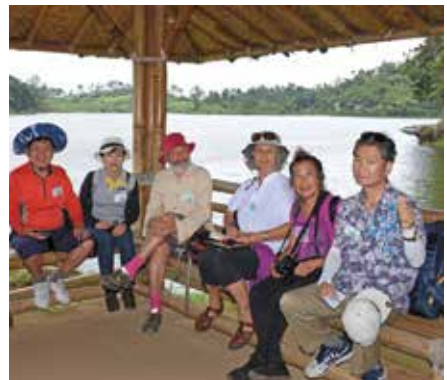
Aliaj esperantistoj en la grupo kaj alia vidpunkto de la lago. Kelkfoje estas bone havi kabanon sen muroj, ĉu ne?