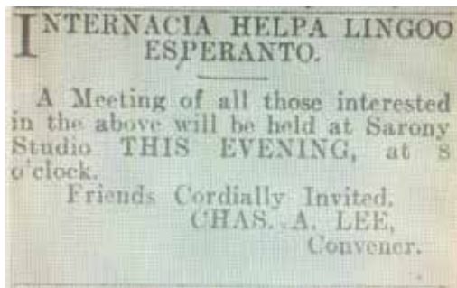
'Kalgoorlie Miner' 14 junio 1906

Bendigo disfalis kiam S-ro H. Gwynne Jones iris Eŭropon por