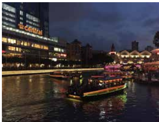
Foto de Singapuro kie mi verkis ĉi tiun antaŭparolon reire hejmen al Nov-Zelando post vizito al Vjetnamio

Laste, mi kredas ke ĉiam utilas en iu ajn asocio aŭ laborejo transdoni taskojn al novuloj. Nova redaktisto de ESK havos pli bonajn, freŝajn ideojn kaj povos plibonigi ĉi tiun revuon. Tial, kiu volas akcepti ĉi tiun gravan postenon? Mi promesas ke la salajro por nova redaktisto duobliĝos. Kalkulu: al kiom egalas duoble neniom?