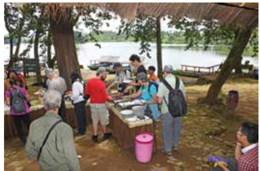
Tagmanĝo apud la lago. Certe estas komforta loko por konversacii kun esperantistoj.