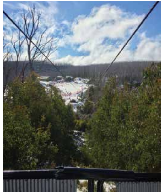
La aventura ŝnuro ne funkciis kiam ni vizitis sed de tie oni povas vidi la ĉefajn konstruaĵojn

Ni decidis fari mallongan promenon antaŭ ol kafumi. Estis bona enkonduko al la pli mola speco de neĝo, kaj mi tre infane paŝadis ĉe la