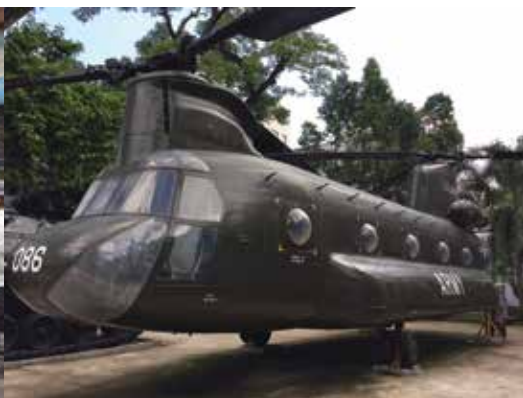
Helikoptero de la usona armeo – unu el la multaj postrestaĵoj ĉe la muzeo pri la milito