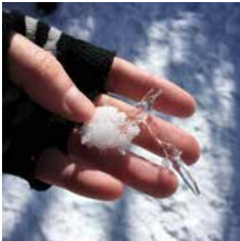
Neĝo kaj glacio

Fine ni atingis la pinton kaj rigardis la belan vidon de tie. Mi trovis la plej molan specon de neĝo kaj multe