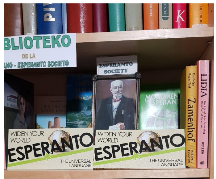
Foto de la Brizbana Esperanto-Biblioteko