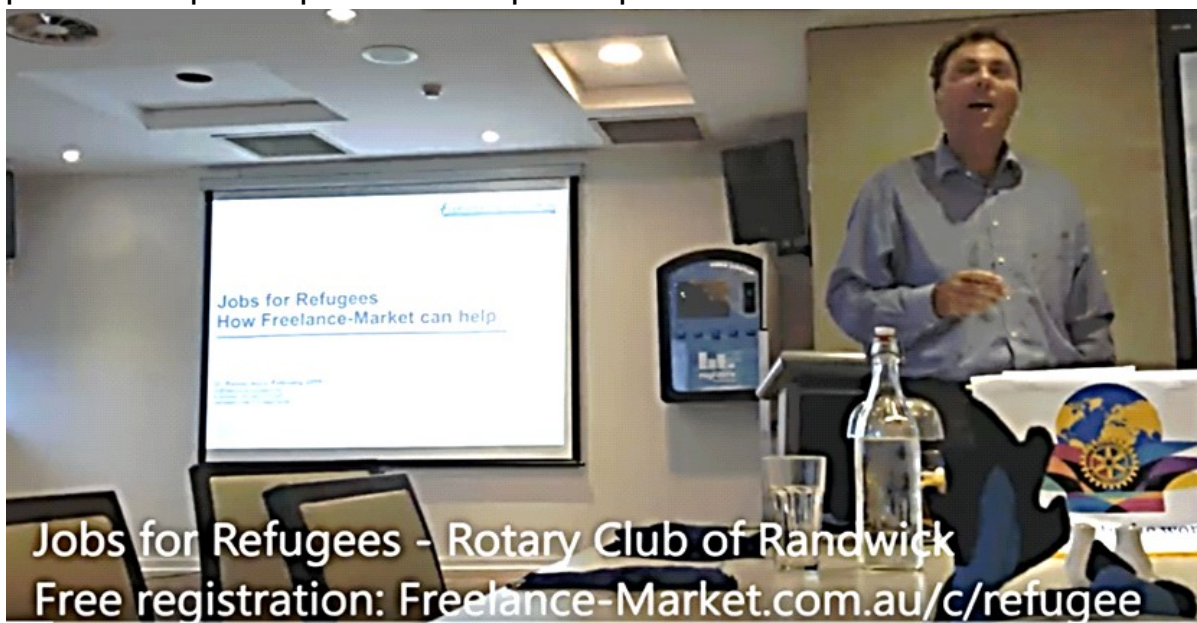
Jobs for Refugees - Rotary Club of Randwick Free registration: Freelance-Market.com.au/c/refugee

Mi volis fari pli multe por Esperanto en Sidnejo, sed dum parto de la tri monatoj mi estis en la Blua Montaro kaj en Kanbero. Ankaŭ mi estis nekredeble okupata por helpi rifuĝintojn en Aŭstralio trovi laboron (mian prelegon pri ĉi tio vi povas vidi je www.youtube.com/watch?v=1OMT93um2pA ). Mi planas reveni fine de 2016. Espereble mi povos pli multe fari por Esperanto tiam.