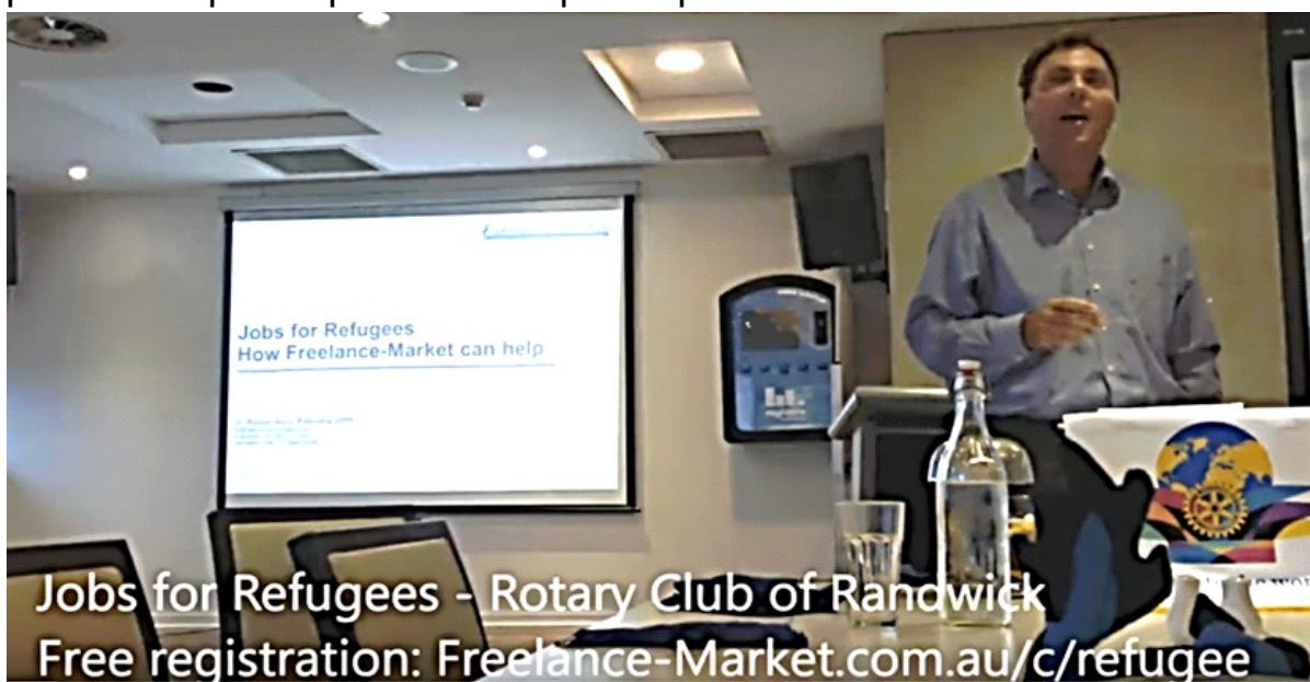
Jobs for Refugees - Rotary Club of Randwick Free registration: Freelance-Market.com.au/c/refugee

Mi volis fari pli multe por Esperanto en Sidnejo, sed dum parto de la tri monatoj mi estis en la Blua Montaro kaj en Kanbero. Ankaŭ mi estis nekredeble okupata por helpi rifuĝintojn en Aŭstralio trovi laboron (mian prelegon pri ĉi tio vi povas vidi je www.youtube.com/watch?v=1OMT93um2pA ). Mi planas reveni fine de 2016. Espereble mi povos pli multe fari por Esperanto tiam.