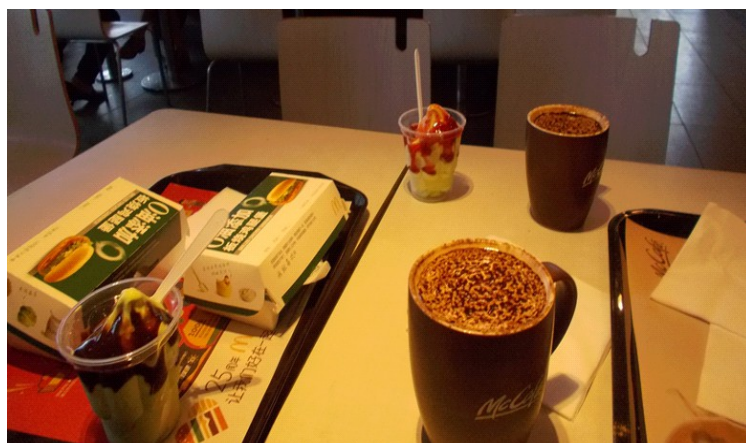
Ne tre ĉin-stila Manĝo ĉe Macdonald (Dankon!)