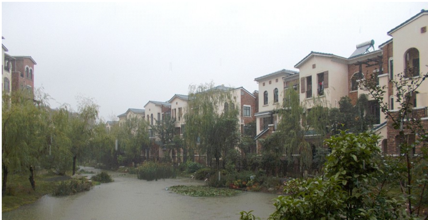
Ĉe antaŭurba loko Unu familianaj 3 etaĝaj loĝejoj apud rivereto