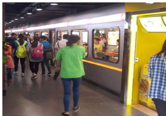
Ŝajna vagonara manĝvendejo ĉe la stacidomo