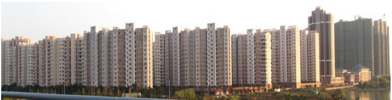
Altaj apartamentoj plenigas la Wuhan-lokon

Vi bezonas nur 5 minutojn ĉiun tagon por Esperantistiĝi. 😊 ★★★